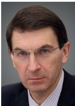
И. О. Щёголев

Полномочный представитель Президента РФ в ЦФО