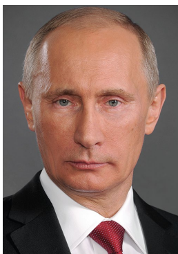
В. В. Путин